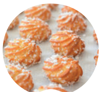
Pâte à choux